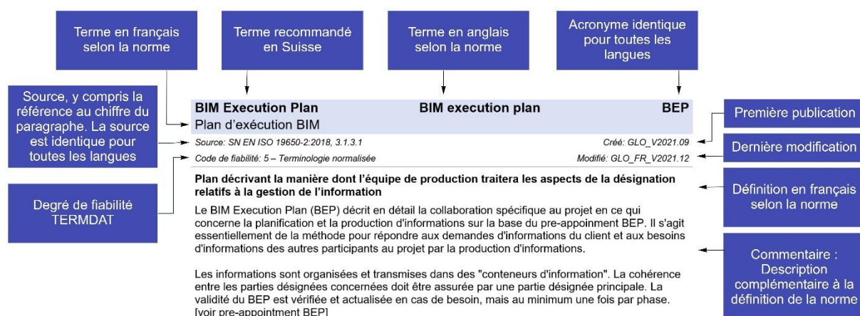
Schéma du glossaire

Les termes du glossaire se réfèrent, lorsqu'ils existent, à la normalisation internationale et nationale. Lorsqu'il n'existe pas encore de termes normalisés, les termes établis dans la pratique sont utilisés.